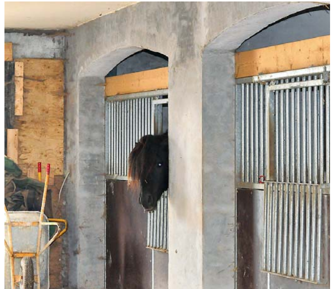
6 store bokse er integreret i 'tre i en'-staldanlægget. Det er kun halm der opbevares inden døre i den ene ende af anlægget, men på grund af det store rumforhold, giver det ikke anledning til støv i staldmiljøet.