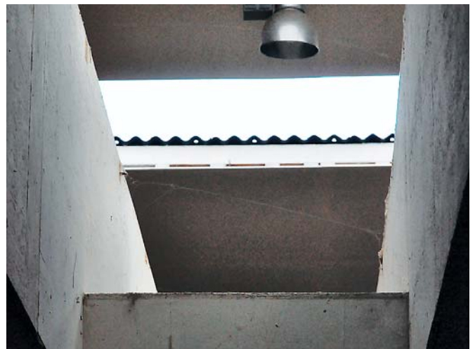
Et godt ovenlys over boksmiljøet sikrer hestene naturligt lys.